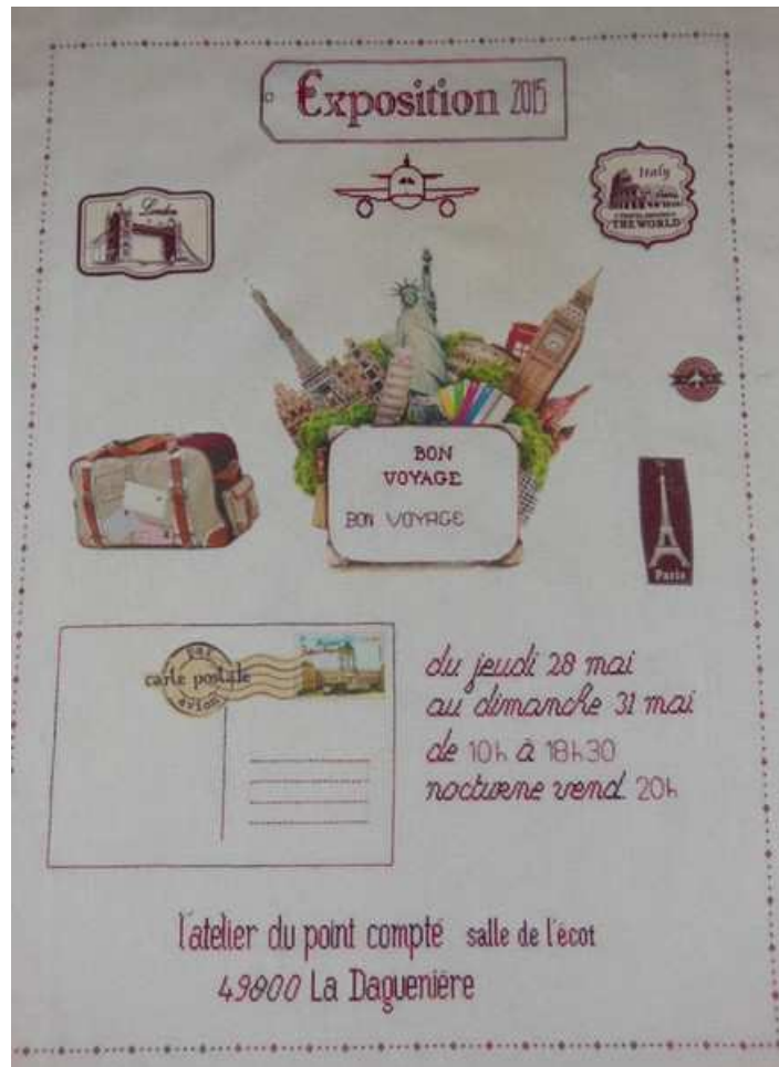
Salle de L'écot